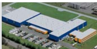
Hörmann KG Antriebstechnik